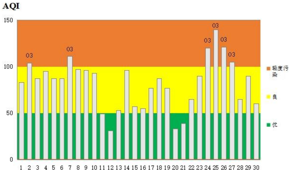
图2 2024年9月鄂州市区空气质量指数分布图

月份鄂州市城区空气质量指数（AQI）最大值 140（9月25日），最小值 31（9月12日）。9月份市区环境空气质量指数和空气质量状况所占比例见图2和图3。