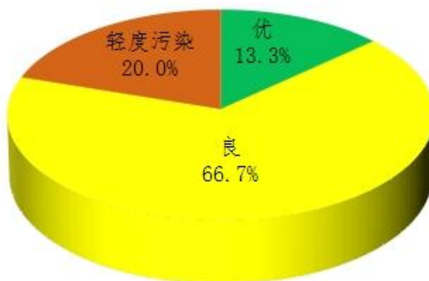
图3 2024年9月鄂州市区空气质量比例图