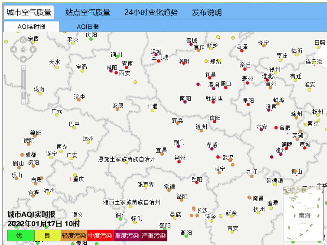
图1：2022年01月17日10时空气质量指数AQI实时分布图

受持续不利气象条件和传输影响影响，截止17日10时，我市空气质量已持续65个小时达到轻度污染水平。目前省内大部分地区以轻度污染为主，荆门、荆州、孝感和武汉达到中度及以上污染水平。省外河南南部以中度到重度污染为主，安徽西南部以重度污染为主，湖南东北部以轻度污染为主。首要污染物均为细颗粒物PM 2.5 。详见图1。